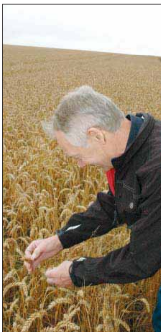
Dækningsbidraget for vinterhvede forventes for 2011 og 2012 at være på højde med rekordåret 2007. (Arkivfoto: Morten Ipsen)

Dækningsbidrag for tre udvalgte afgrøder. Kilde: Produktionsøkonomi Planteavl 2011 fra Videncentret for Landbrug.